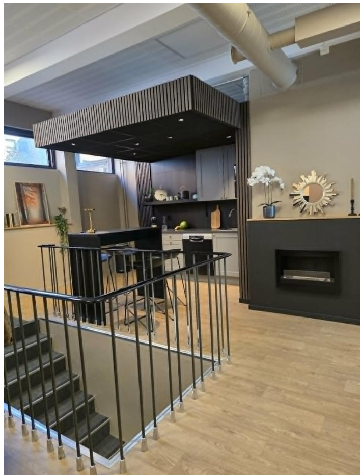
Kjøkken med spise plass