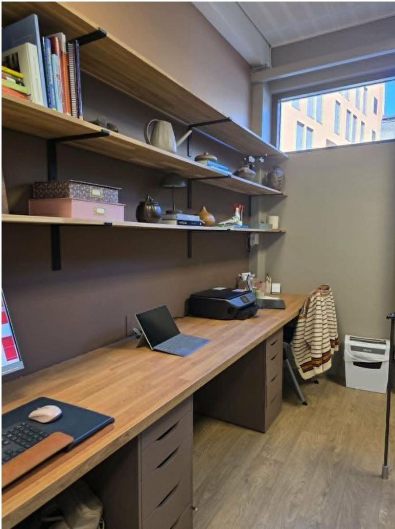
Felles kontor plass